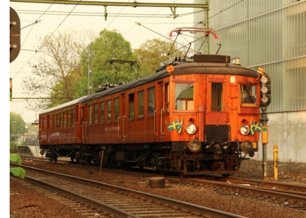
Saltsjöbanans veteranvagnar i Nacka den 19 maj 2013

Hyr Saltsjöbanans veteranståg för resan, middagen, konferensen eller festen.