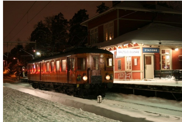
Motorvagn 15 i Saltsjö-Duvnäs, den 13 december 2012

Motorvagn 15 har sedan 1993 använts för olika typer av abonnemang och evenemang. Under 2013 har vagnen fått sällskap av manövervagn 22 som vi inrett till en bar-, middags- och mingelvagn. Vi erbjuder transport till festligheterna, ett annorlunda företagsevenemang eller varför inte en middag ombord.